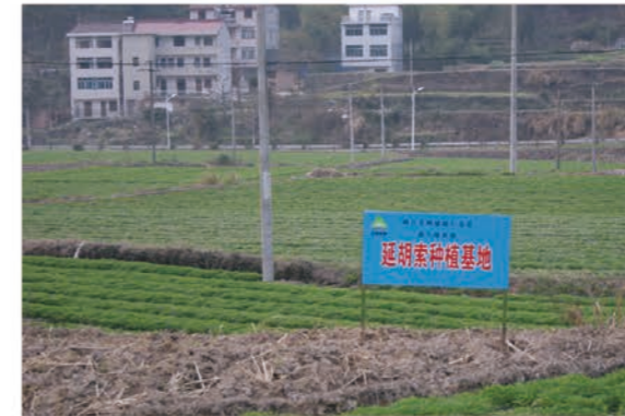
浙江磐安延胡索种植基地