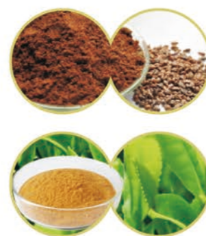
【配方】葡萄籽提取物、茶多酚、天然维生素E浓缩油、磷脂