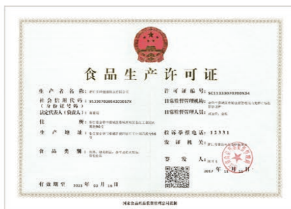
食品生产许可证 (含固体饮料、植物提取饮料、保健食品)