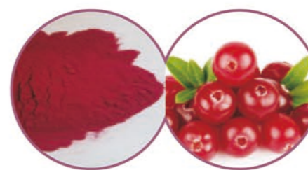
【配方】蔓越莓提取物、维C、甜味剂