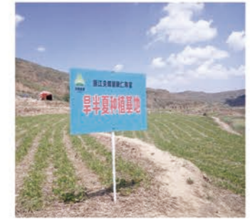
甘肃陇南旱半夏种植基地