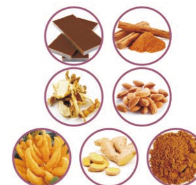
【配方】葡萄籽提取物、茶多酚、天然维生素E浓缩油、磷脂