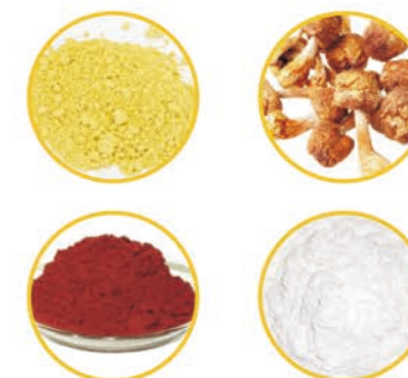
【配方】松花粉提取物、姬松茸提取物、葡萄皮提取物