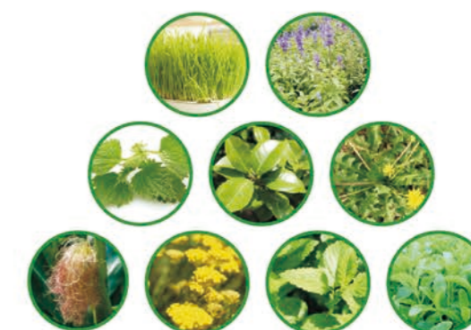
【配方】小麦草、鼠尾草、苜蓿、山茶、蒲公英、玉米须、蜡菊、薄荷、甜菊叶