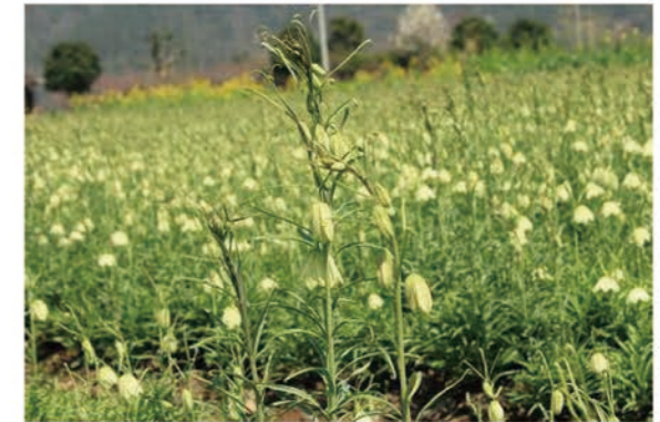
浙江磐安浙贝母种植基地