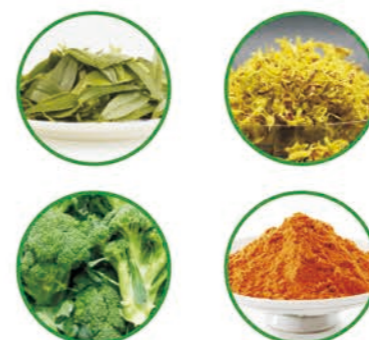
【配方】铁皮石斛叶、铁皮石斛花、西兰花提取物、枸杞粉