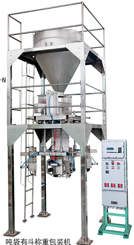
吨袋有斗称重包装机